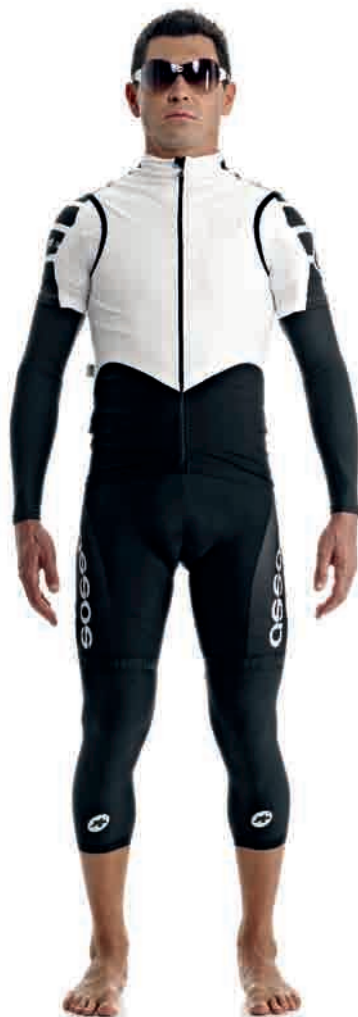
TM SS.UNO arm UNO_S knee UNO_S